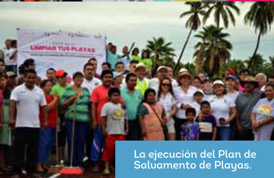
La ejecución del Plan de Salvamento de Playas.

Dentro del proceso de calendarización e integración de expedientes de acciones y obras estratégicas para Lázaro Cárdenas, se encuentra la construcción de un nuevo Hospital Regional .