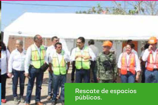
Rescate de espacios públicos.