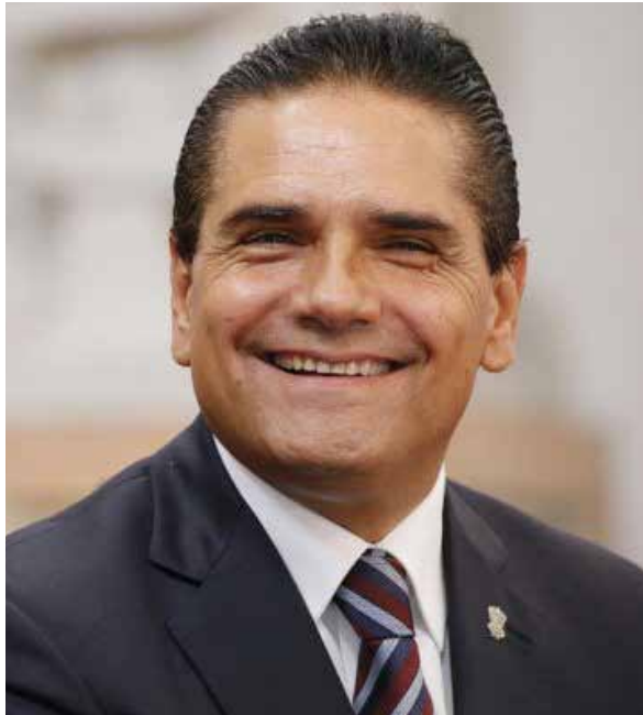
Silvano Aureoles Conejo Gobernador Constitucional del Estado de Michoacán