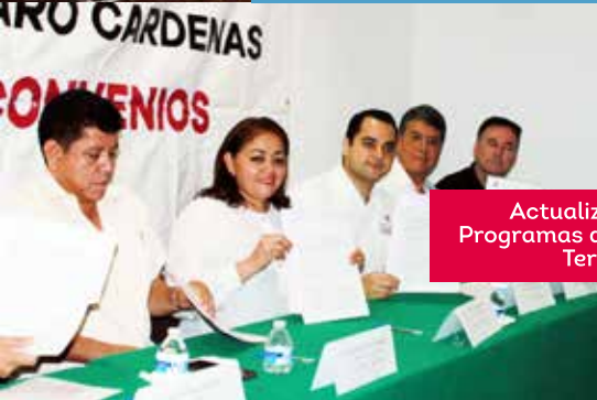
Actualización de los Programas de Ordenamiento Territorial.